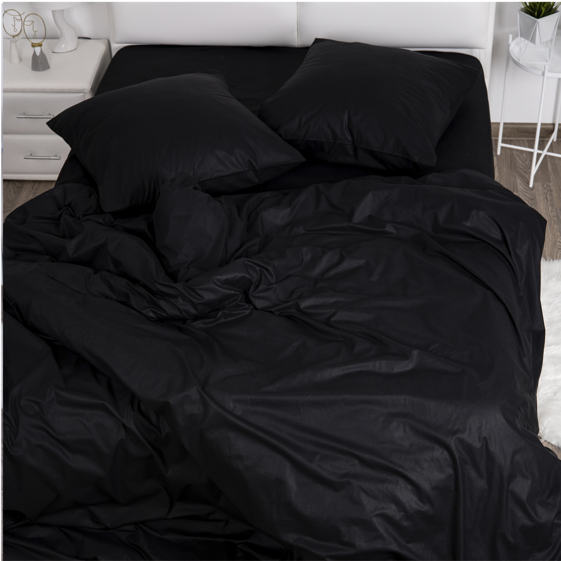
«БЛЭК» Арт. 70005 Поплин 220 см